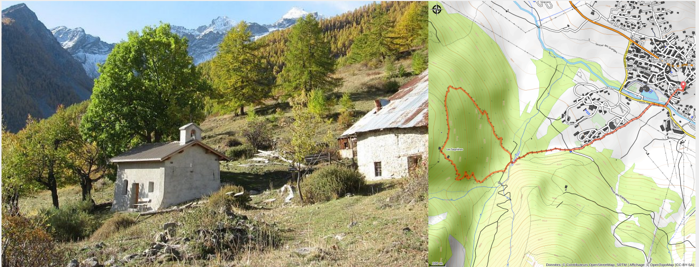
Hameau des Sagnières

Joli parcours en forêt pour remplir une demi journée de randonnée sur les premières pentes du tabucs.